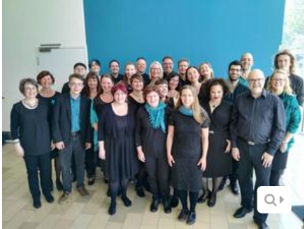
Gospelchor "Salttown Voices" vor dem Wertungssingen

Halle (Saale): Konzerthalle Ulrichskirche | Voller Stolz und Inspirationen kehrte der Hallenser Gospelchor "Salttown Voices" am Sonntagabend vom diesjährigen "Gipfeltreffen der Chormusik" aus Freiburg im Breisgau zurück. Unter dem Motto "gemEINSAME SPITZE" fand dort vom 5. bis 13. Mai 2018 der 10. Deutsche Chorwettbewerb statt, der bundesweite Leistungsvergleich der besten Laienchöre, die sich zuvor in Landeswettbewerben ihrer Bundesländer für die Teilnahme qualifiziert hatten. Dieses Bundesfinale findet nur alle 4 Jahre statt. Eine Woche lang war Freiburg ein herzlicher Gastgeber für das Beste, was die